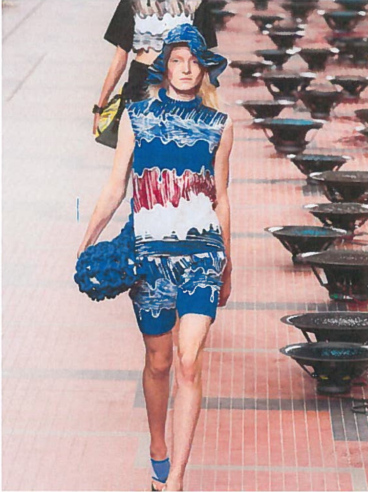
Défilé Kenzo printemps-été 2014.

>>> EN IMAGES: Cliquez ci-dessous pour voir le défilé Kenzo printemps-été 2014 en images