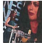
Festival de Cannes 2013 : Les moments forts, choquants, scandaleux ou émouvants