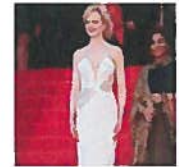
Cannes 2013 : Palmarès des tenues les plus élégantes et originales du Festival

Virginie Efraïm maman d'une petite fille : retour sur une grossesse très épanouie